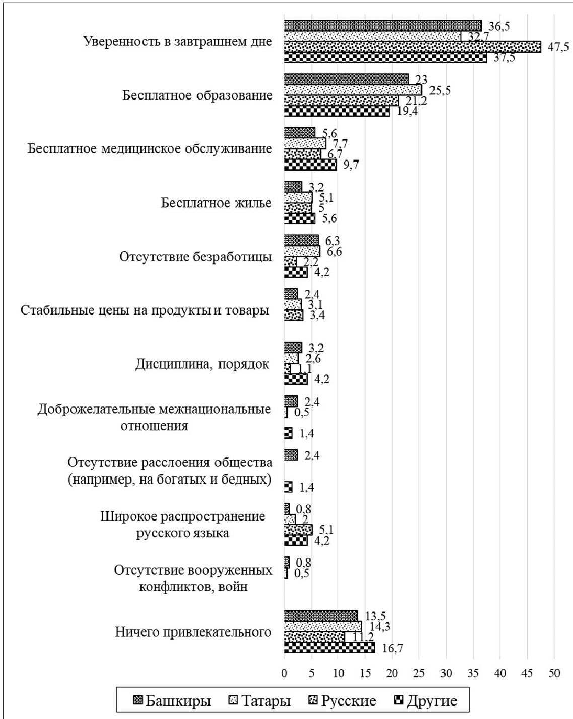
Рисунок 1 — Как Вы считаете, было ли что-то особенно привлекательным в «советской жизни» (можно выбрать несколько вариантов ответов)? [7]