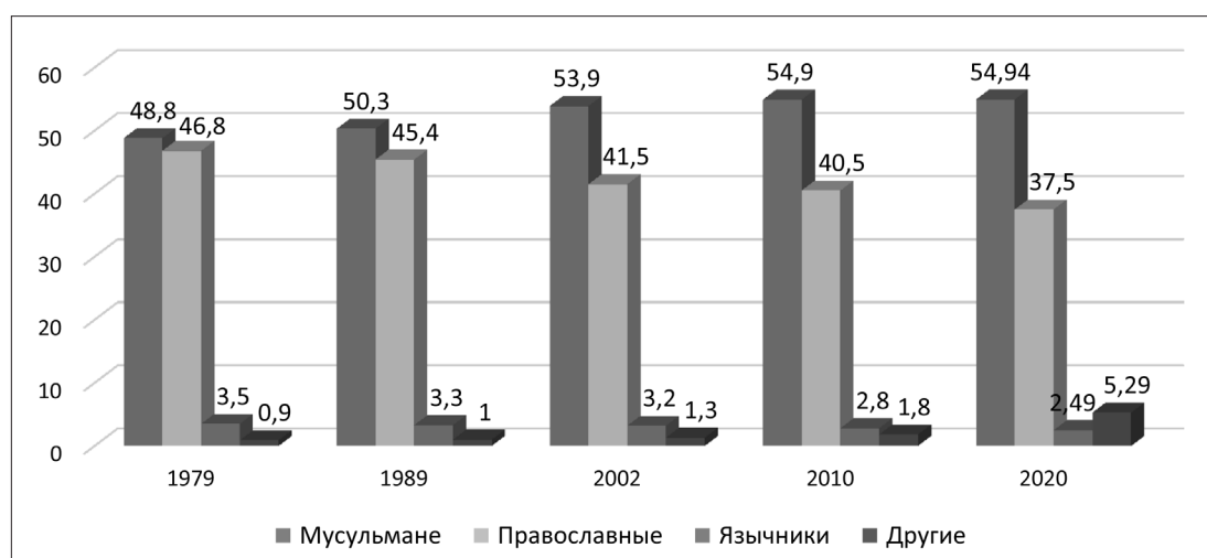
Рисунок 1. Эволюция конфессионального состава населения Башкортостана в позднесоветское и постсоветское время (по результатам переписей 1979–2020 гг.), % (рассчитано и составлено автором по материалам Всесоюзных (1979 и 1989 гг.) и Всероссийских (2002, 2010 и 2020 гг.) переписей населения)

Данные опросов показывают, что в первое десятилетие XXI в. процесс религиозного ренессанса в республике сохранял высокую интенсивность. Особенно отчетливо это проявлялось в мусульманской среде. Так, по итогам репрезентативного исследования 2011 года, проведенного московскими социологами, среди респондентов, соотносивших себя с мусульманской традицией, 31,5 % указали, что являются верующими и стараются соблюдать религиозные обряды, а 58,8 % отнесли себя к категории верующих, но не соблюдающих их в полной мере [4, с. 73–86]. Следовательно,