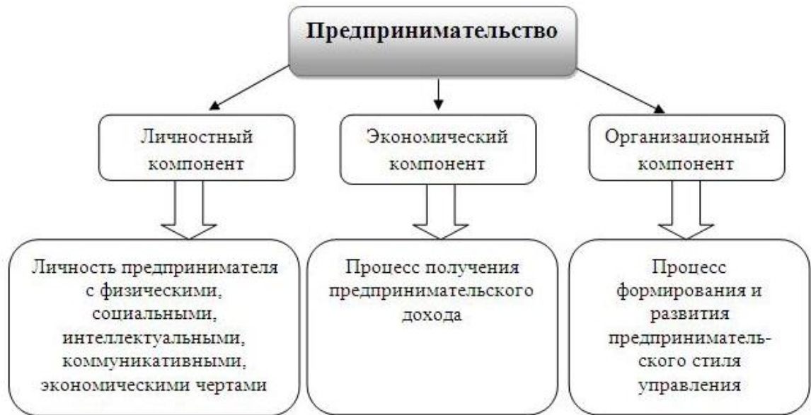
Рисунок 1. Компоненты предпринимательства

Исследованию необходимых личностных характеристик предпринимателя посвящено немало научных работ, в которых исследователи приходят к выводу о том, что предприниматели, в отличие от добившихся успеха менеджеров крупных компаний, стремятся лучше от жизни нечто иное. Оритетными для них являются