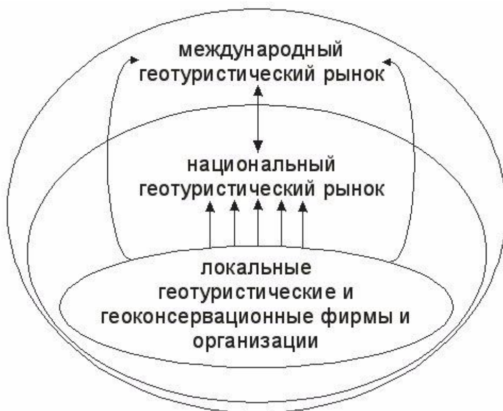
Рисунок 3. Иерархическое положение национального геотуристического рынка

геотуристического рынка относительно международного. Дело в том, что создание сети геопарков в разных странах способствовало развитию последнего ускоренными темпами [1]. В этой связи представляется, что локальные туристические фирмы и организации, созданные при содействии муниципальных или региональных органов должны выходить сразу как на национальный, так и на международный рынок (рис. 3). Для этих целей, в частности, могут использоваться уже существующие международные программы взаимодействия в области геоконсервации, например, координируемые ProGEO. Одновременно государственная стратегия