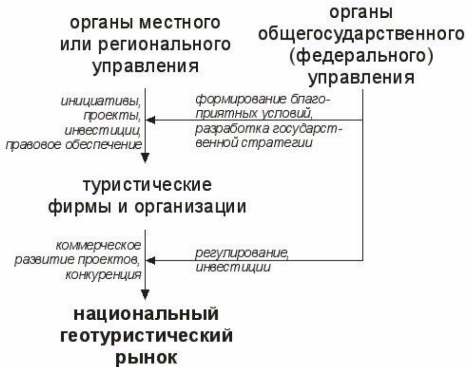
Рисунок 2. Общая схема формирования национального геотуристического рынка

Таким образом, задача формирования национального геотуристического рынка оказывается не только весьма специфической, но и требующей принятия последовательных решений (рис. 2). В пределах России, характеризующейся не только огромной территорией, но и исключительно разнообразным геологическим строением, представляется целесообразным создание своего рода кластеров, в которых геотуризм будет дополнять другие виды туризма. Примером такого кластера можно считать горную часть Республики Адыгея на Северном Кавказе. С одной стороны, здесь концентрируется большое количество уникальных геологических объектов [6]. С другой –