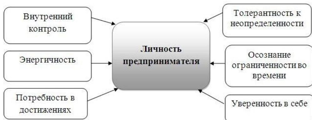
Рисунок 2. Характерные черты предпринимателя

ностная свобода и возможность полностью раскрыть свой ал. Учеными было вано около 40 присущих предпринимателям черт, из которых особое значение для успешности нимателя имеют шесть стик, представленных на рис.2 [2].