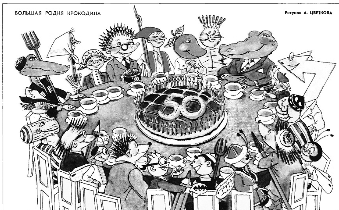
Рисунок 1 — Большая родня «Крокодила». Рис. А. Цветкова («Крокодил», 1972, № 5)

Сразу необходимо отметить, что, несмотря на традиционную популярность юмористических сюжетов, основанных на этнической тематике [13], процент этнических карикатур в «Крокодиле» был невелик и в среднем не превышал 2–2,5% от общего числа иллюстраций (1960-е — 2,1%, 1970-е — 2,3%). Эта диспропорция уже была замечена при исследовании текстов в официальных юмористических журналах [9]. Отчасти это можно объяснить тем, что все национальные республики имели свои юмористические журналы, аналогичные «Крокодилу» по функциям и стилистике. Даже некоторые автономные республики получили своего рода сатирически-пропагандистскую франшизу. Аналоги выпускались в шести автономных республиках РСФСР: «Чушканзи» («Оса») в Коми АССР, «Чаян» («Скорпион») в Татарской