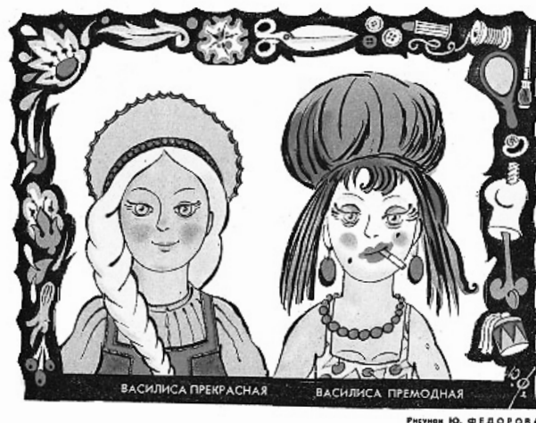
Рисунок 3 — «Василиса Прекрасная / Василиса Премодная».

По сравнению с шестидесятыми, можно говорить об усилении коллективного образа