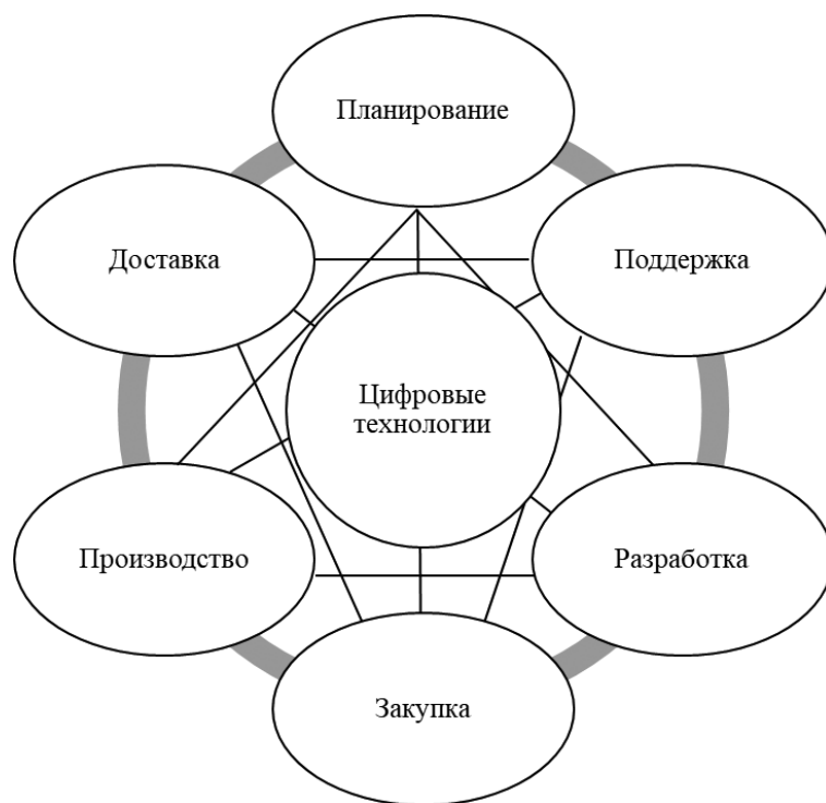
(б) — Цифровая цепочка поставок