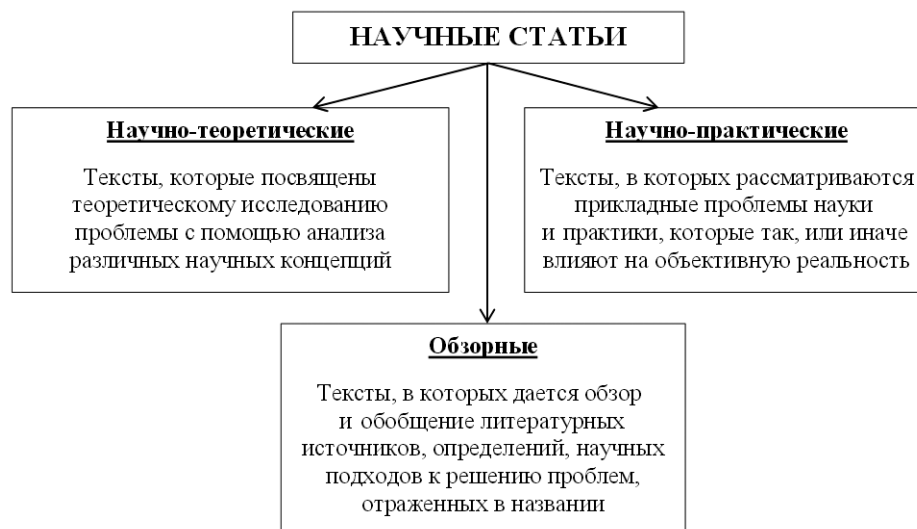
Рисунок 1 — Типология научных статей

К указанным типам научных публикаций предъявляются в целом достаточно схожие требования, среди которых: